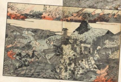
『安政見聞誌』(西尾市岩瀬文庫蔵)

事前予約・参加費不要 Free admittance No pre-registration required