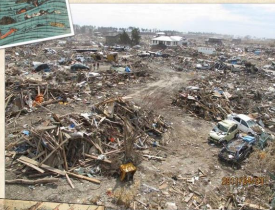
東日本大震災後の名取市真山堤周辺